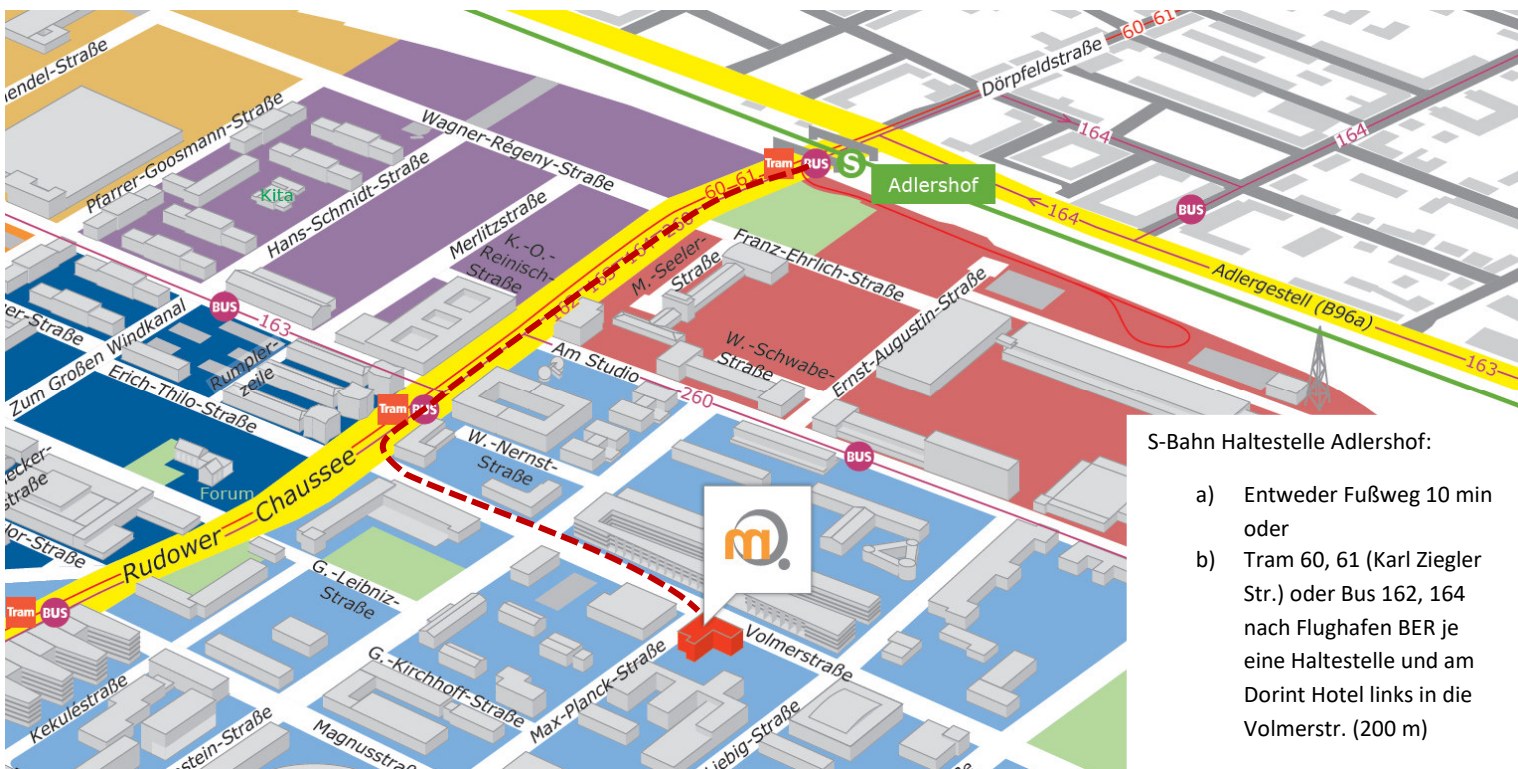
S-Bahn Haltestelle Adlershof: