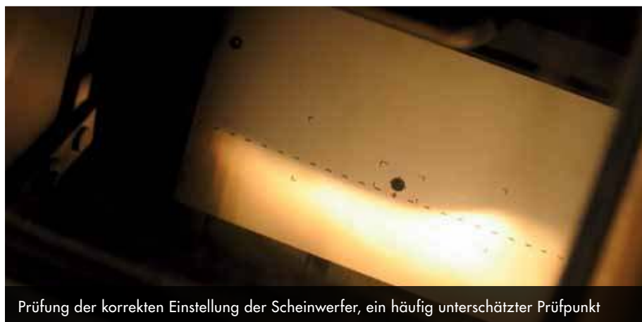
Prüfung der korrekten Einstellung der Scheinwerfer, ein häufig unterschätzter Prüfpunkt

Alle Auditoren beurteilen die Fahrzeuge und deren Mängel mit nahezu gleicher und hoher Sorgfalt. Schnell identifizierten sich die Auditoren mit