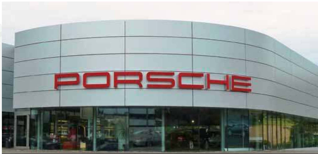
Porsche Zentrum Heilbronn